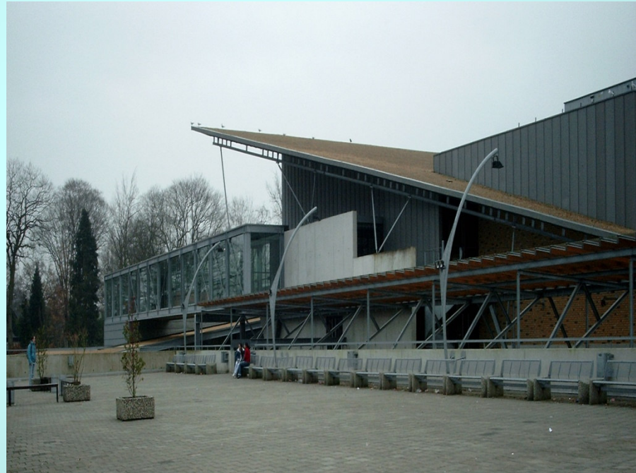
College De Brink - Afdelingskeuzes